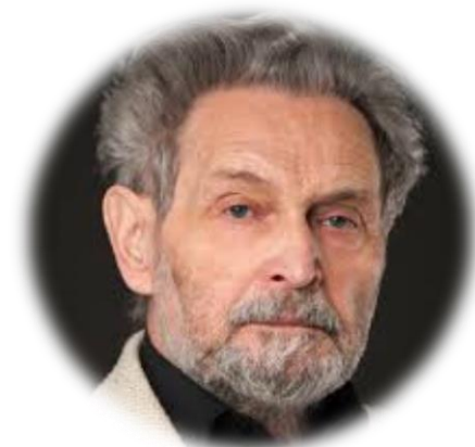
Ur. 19.05.1943, Warszawa, poeta, eseista, dramaturg i filozof