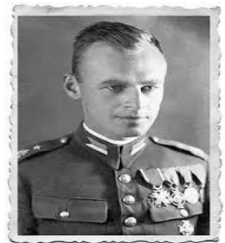
Witold Pilecki – więzień KL Auschwitz (Oświęcim)