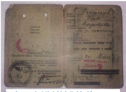
Legitymacja Miejskich Zakładów Komunikacyjnych

Nasielsku. W roku 1926 15 marca został powołany do czynnej służby wojskowej do Pierwszego Oddziału Służby Uzbrojenia w Modlinie. Służył jako ogniomistrz. Niestety, nie zachowały się dokumenty z pracy na kolei, lecz z Kwestionariusza dotyczącego okresów zatrudnienia, ankiet osobowych oraz kopii życiorysów wynika, że z PKP związany był w latach 1919-1926 i 1927-1938 z przerwą na zasadniczą służbę wojskową.