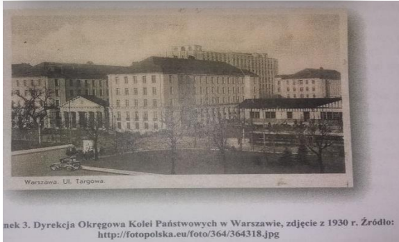
Obrazek 3. Dyrekcja Okręgowa Kolei Państwowych w Warszawie, zdjęcie z 1930 r.

Piotr Fronczak – życiorys tyleż ciekawy co tajemniczy. Okazuje się, że na temat dzieciństwa Piotra nic nie wiadomo. Po prostu nie ma dokumentów. Wiadomo, że do ok. 15 roku życia był przy rodzicach.