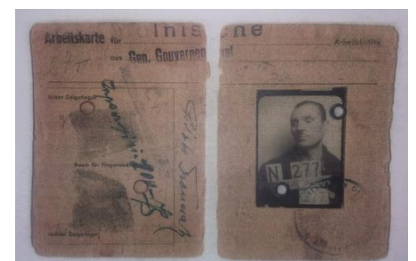
Arbeitskarte (Karta Pracy)